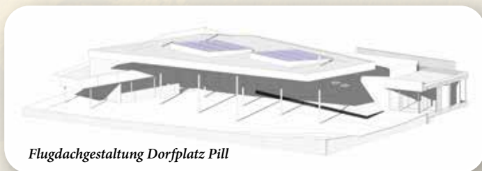
Flugdachgestaltung Dorfplatz Piller