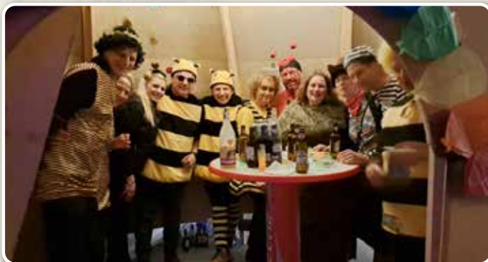
Bericht und Fotos: Ortsbäuerinnen Pill/Pillberg

Auch heuer veranstalteten wir eine Faschingsparty mit Kinderfasching im Bauhof Pillberg. Viele Besucher am Nachmittag und Abend machten die Party zu etwas besonderem. Vielen Dank an die zahlreichen verkleideten Besucher.