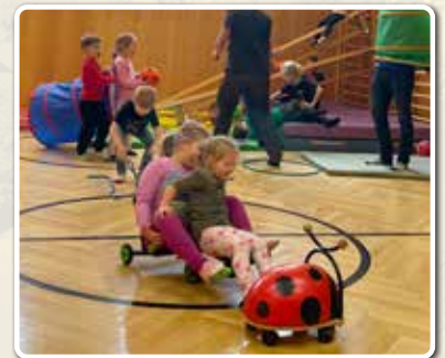
Bericht und Fotos: Landjugend / Jungbauernschaft/Pillberg

Wie jedes Jahr fand unser Spielenachmittag am 24.12. statt. Es machte wieder riesig Spaß mit den Kindern zu spielen und ihnen somit auch das Warten auf das Christkind etwas zu verkürzen. Zum Schluss haben wir noch unser Ausschusswichteln aufgelöst. Wir bedanken uns bei allen, die dabei waren.